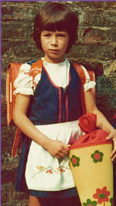
Einschulung Sandra Scheeres Senatorin für Bildung, Jugend und Wissenschaft des Landes Berlin