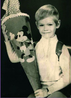
Einschulung Michael Müller Landesvorsitzender der SPD Berlin